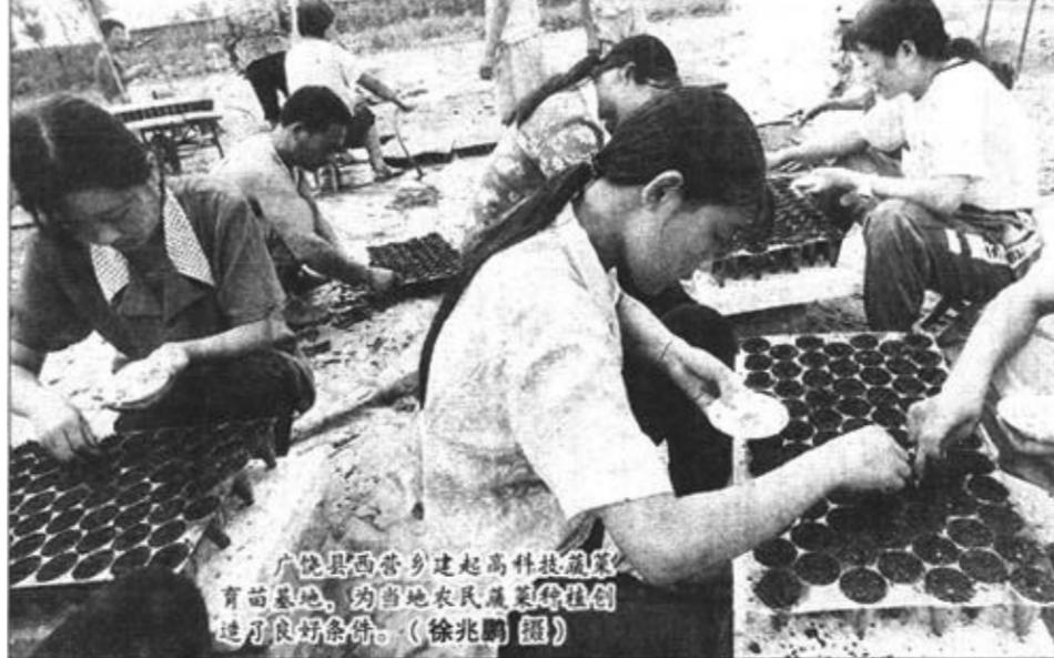
本版编辑 聂丽芳