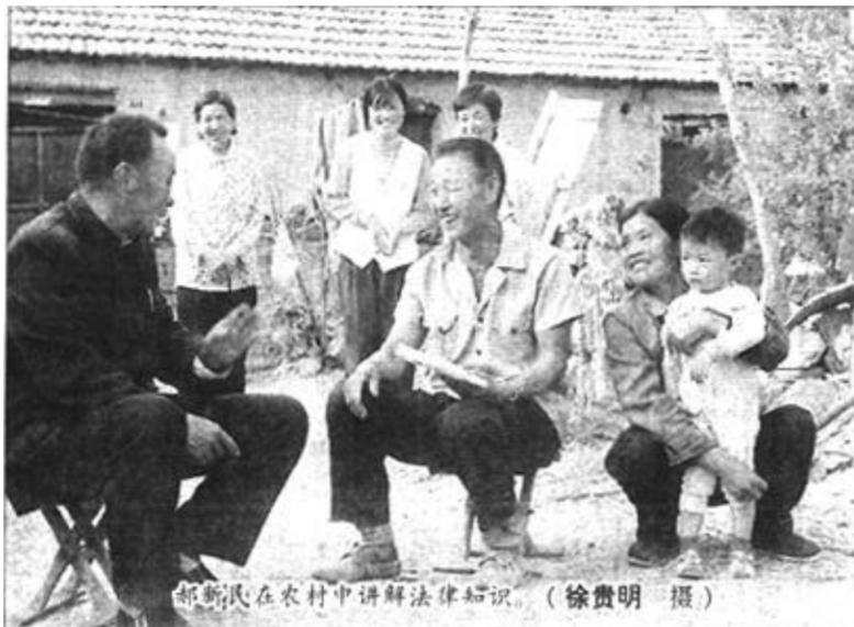
邮递员在农村中讲解法律知识。

彩的老年文体活动。投资300多万元建起了东营区老年康复楼。各乡镇普遍修建了门球场和活动室。各级老龄委、政府还不断改善敬老院的条件，全区8处敬老院设施齐全、服务优良，为孤寡老人安度晚年创造了良好的条件。辛店镇、史口镇、牛庄镇三个敬老院多次被评为省级文明敬老院。去年底，辛店镇东赵村在社会各界的大力支持下，投资240万元，率先在全市建起了第一家村级老年公寓，现已有18位老年人在此安家落户，在社会养老方面迈出了可喜的一步。（冯先明 张保华）