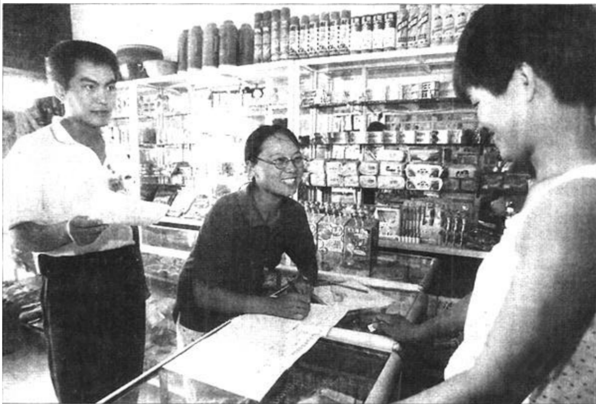
东营区东城街道办事处开发区居委会针对企业职工及流动人口,采取多种措施,使辖区各项指标均达百分之九十八以上。